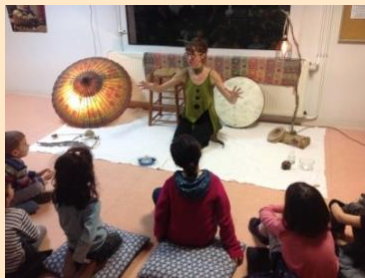
Conférence contée : Botanik'hom (histoires écolos) Bibliothèque Sarah Bernhardt Veneux les Sablons