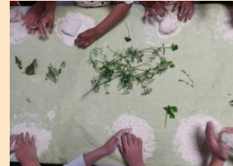
Atelier pain aux herbes aromatiques avec les enfants de l'école Curie et les personnes âgées du foyer Bellefeuille à Montereau