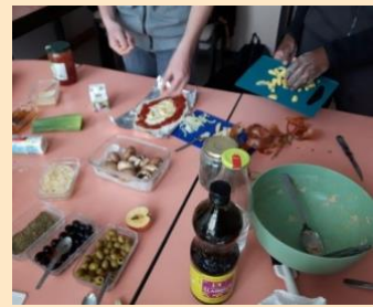
Atelier cuisine pizza de saison au lycée Sonia Delaunay à Cesson