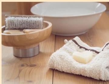
Atelier produits hygiène et entretien de la maison lessive et gel douche au centre de détention de Melun