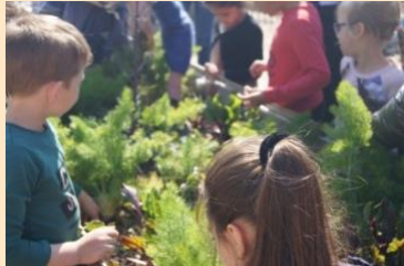
Atelier « Je dis Jardin ! » avec les enfants de l'école Curie et les personnes âgées du foyer Bellefeuille à Montereau