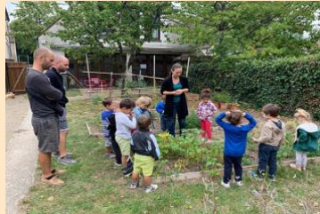
Atelier jardinage avec les enfants à l'école maternelle Alfred Binet Samois sur Seine